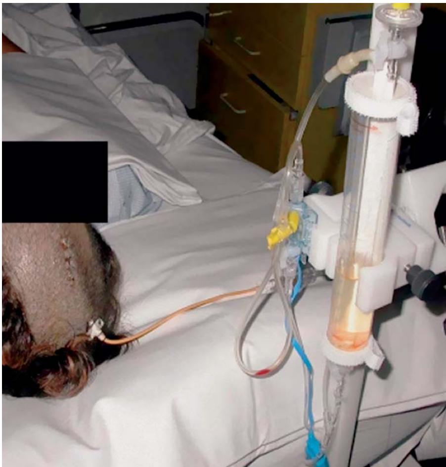
Abbildung 1: Drainage zur passageren Druckentlastung

Bei der Drain-assoziierten Ventriku­litis überwiegen Gram-positive Erreger wie Staphylococcus epidermidis , Staphylococcus aureus , Streptokokken, Enterokokken, Peptokokken, Propionibakterien und Corynebakterien. Gram-negative Keime wie Klebsiellen, Pseudomonas , Enterobakterien, Proteus , Acinetobacter , E. coli oder Serratia bzw. Pilze sind seltener, aber